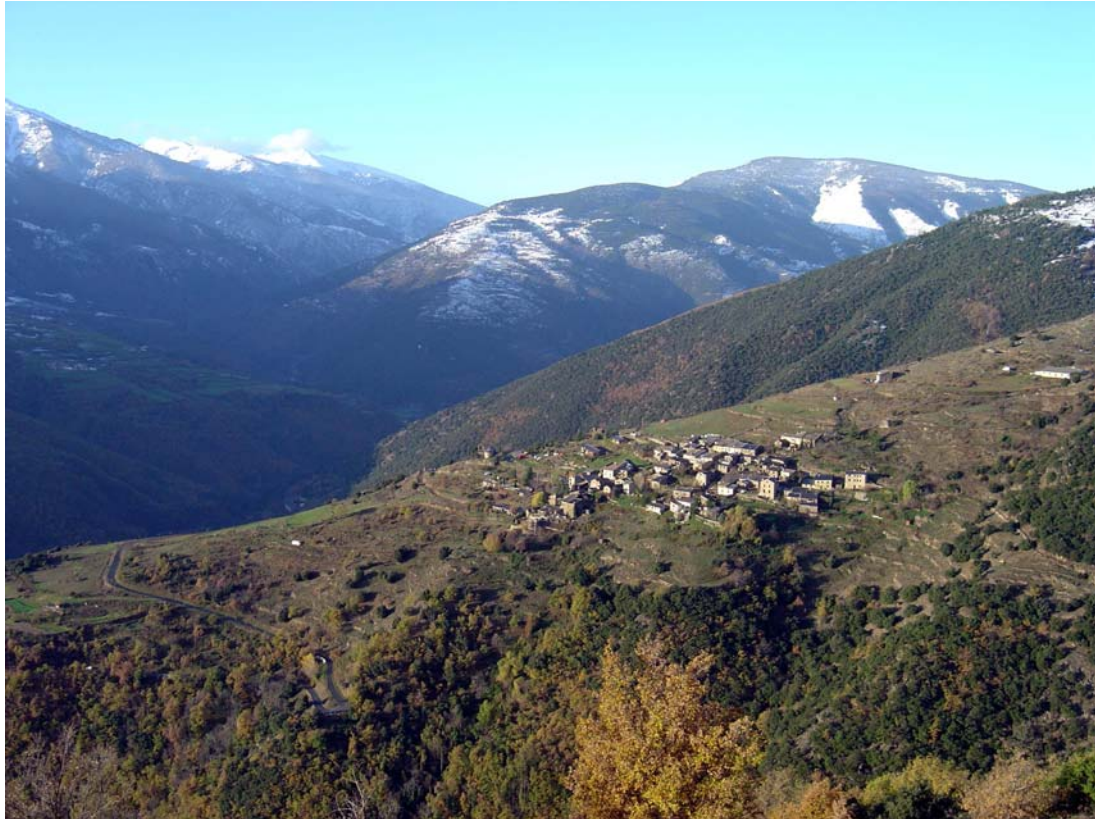
Vue du village de Jujols (66), Novembre 2006