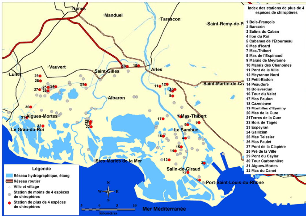
Figure 1 : Cartographie des sites d'observation de Chiroptères en Camargue pendant la période 1995-2005.