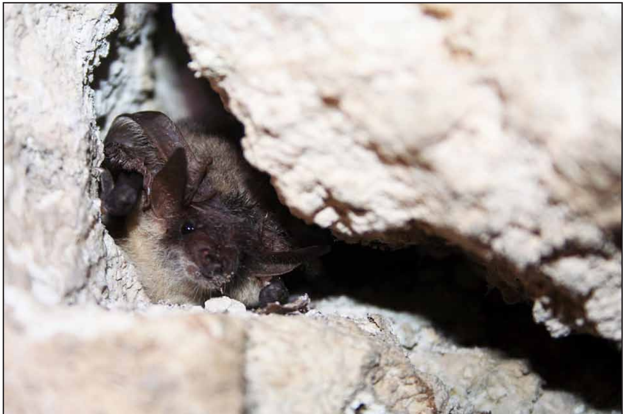
Oreillard gris.

Toutes les espèces de chauves-souris, y compris celles qui ne sont pas inscrites au titre de l'annexe II de la Directive Habitat ont été intégrées à ce travail. Les données recueillies ont été complétées et commentées par des observations personnelles, ainsi que par la bibliographie existante.