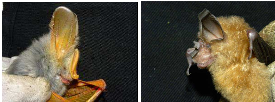
Photo 10 et 11. Deux espèces capturées au Mali, Lavia frons et Rhinolophus landeri

Au Mali, 30 espèces de chauves-souris (incluant le groupe de Nycteris gambiensis/thebaica et le groupe Scotophilus sp. nov ? ) ont été capturées pour un total de 186 individus sur 20 soirées de capture (Tableau 1). Les captures ont eu lieu du 17 janvier au 24 février 2011.