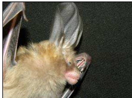
Photo 6 et 7. Deux familles capturées au Sénégal : les Rhinolophidés ( Rhinolophus fumigatus ) à gauche et les Nyctéridés ( Nycteris macrotis ) à droite