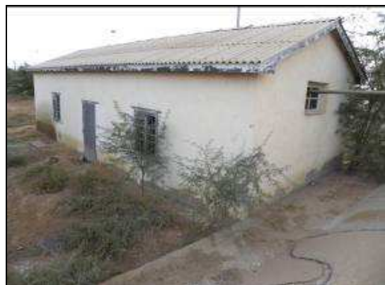
Photo 14 et 15. La colonie d' Asellia tridens de l'ancien abattoir de Kaedi et le bâtiment abritant plusieurs Nycteris sp. à Rosso