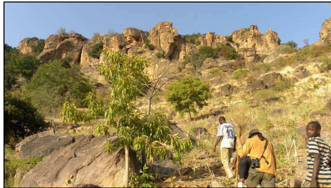
Photo 2 et 3. Une des nombreuses difficultés à franchir avec le véhicule en Mauritanie à gauche et début de randonnée pour aller visiter des grottes avec des villageois dans la région du Mandingues au Mali à droite.