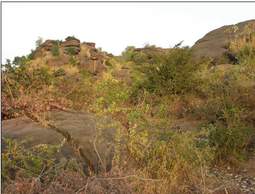
Photo 1. Milieu rocheux avec végétation arbustive à quelques kilomètres de Bamako (Mali) à Baguineda

C'est dans ce contexte, pour contribuer à l'effort global de connaissance et de protection de la biodiversité en Afrique de l'Ouest que cette étude a été mise en place. De novembre 2010 à février 2011, des séances de capture et de recherches de gîtes à chauves-souris ont été réalisées dans trois pays d'Afrique de l'Ouest : le Sénégal, la Mauritanie et le Mali . Ce rapport a donc pour objectif de synthétiser les inventaires réalisés dans ces trois pays.