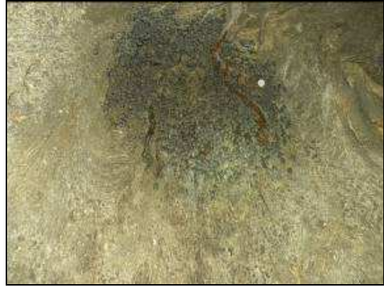
Photo 12 et 13. Une Nycteris sp. et une colonie de chauves-souris ( Rhinolophus fumigatus ) trouvée au Sénégal dans un vieux et grand baobab de la région de Joal-Fadiout