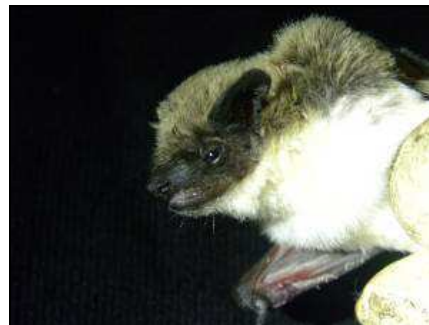
Photo 8 et 9. Deux des espèces capturées en Mauritanie, Rhinopoma harwickii et Pipistrellus rueppellii