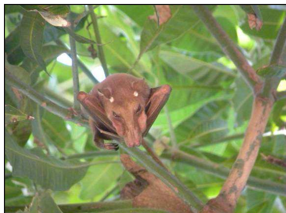
Photo 4 et 5. Site de capture, au bord du fleuve Balé (Mali) et arbre gîte d'une Epomophorus gambianus à Ndiaffat (Sénégal)